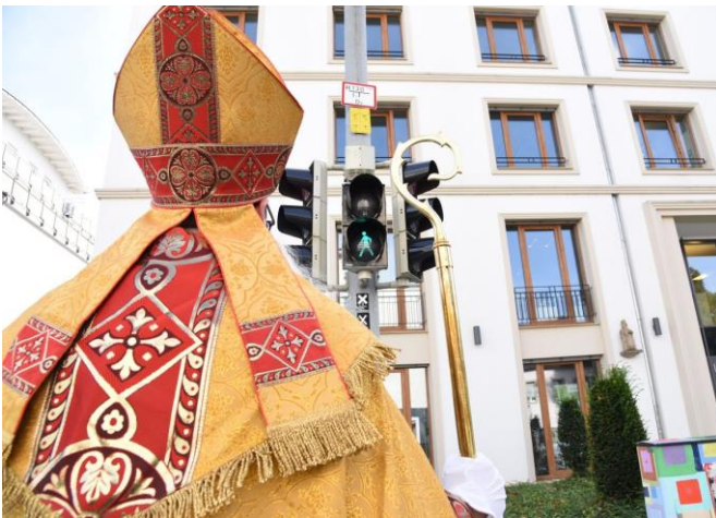
Startklar: Die „Tat.Ort.Nikolaus“-Aktion des Bonifatiuswerkes kann beginnen.

Die „Tat.Ort.Nikolaus“-Aktion gehört zur bundesweit bekannten „Weihnachtsmannfreien Zone“, die das Hilfswerk vor 22 Jahren ins Leben gerufen hat, um den heiligen Nikolaus mit seinen christlichen Werten wie Gerechtigkeit, Nächstenliebe und Hilfsbereitschaft wieder mehr in den Fokus der Gesellschaft zu rücken. Prominente Unterstützung erfährt die Initiative neben Udo Lindenberg, der für diese Aktion einen Nikolaus gemalt hat, auch von Sängerin Maite Kelly. „Die Legenden besagen, dass Nikolaus ein echt guter Heiliger war. Echt sein, heißt menschlich sein. Diese Botschaft ist hochaktuell. Mehr denn je brauchen wir einander“, betont Maite Kelly, die stolz sei, seit vielen Jahren die Patin der Nikolausaktion zu sein.