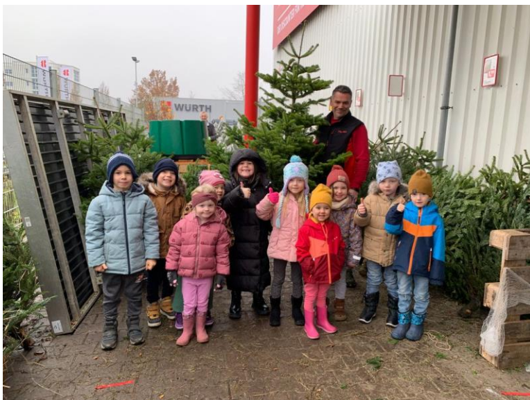
Bild (Kita): Zehn Kinder der Kita St. Martin aus Barbing durften den Weihnachtsbaum aussuchen. Den bekamen sie mit dem Ständer auch noch geschenkt.

Bilder Elli Ernst/Bericht C. Kroschinski