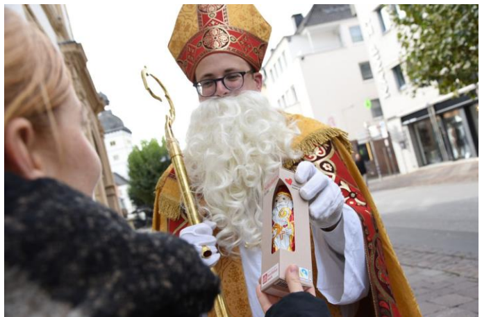
Logo: Heiliger Nikolaus/ Weihnachtsmannfreie Zone. Grafik: Bonifatiuswerk

Der heilige Nikolaus bereitet mit einem Schokokenikolaus eine kleine Freude.