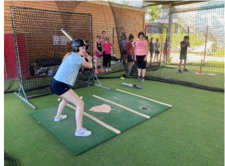
Das Ministrantenoutfit wurde gegen Sportkleidung eingetauscht.

Nachdem das eigene Können derart unter Beweis gestellt wurde, gab es zur Stärkung Burger aus dem Restaurant der Legionäre, dem Beach House. So fand ein toller Tag in der Regensburger Baseballwelt einen würdigen Abschluss.