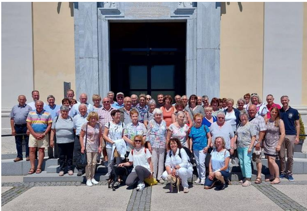
Bild: Bei der Pfarrfahrt feierte man einen Gottesdienst in Maria Taferl, dem bedeutendsten Wallfahrtsort Niederösterreichs